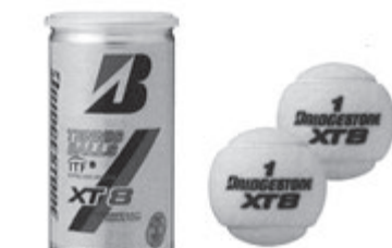
XT8 (2個入り) エックスティエイツ

摩耗を防ぎながら上質な風合いとソフトな打球感を実現するため、柔軟で豊かな風合いを持つワールと、厚手に強いナイロンを最適なバランスで組み合わせることによって、クレーコートはもちろん、厚手の早いハードコート、毛羽立ちが多く厚手の遅い砂入り人工芝コートなど、あらゆるタイプのコートで優れた耐久性を発揮します。