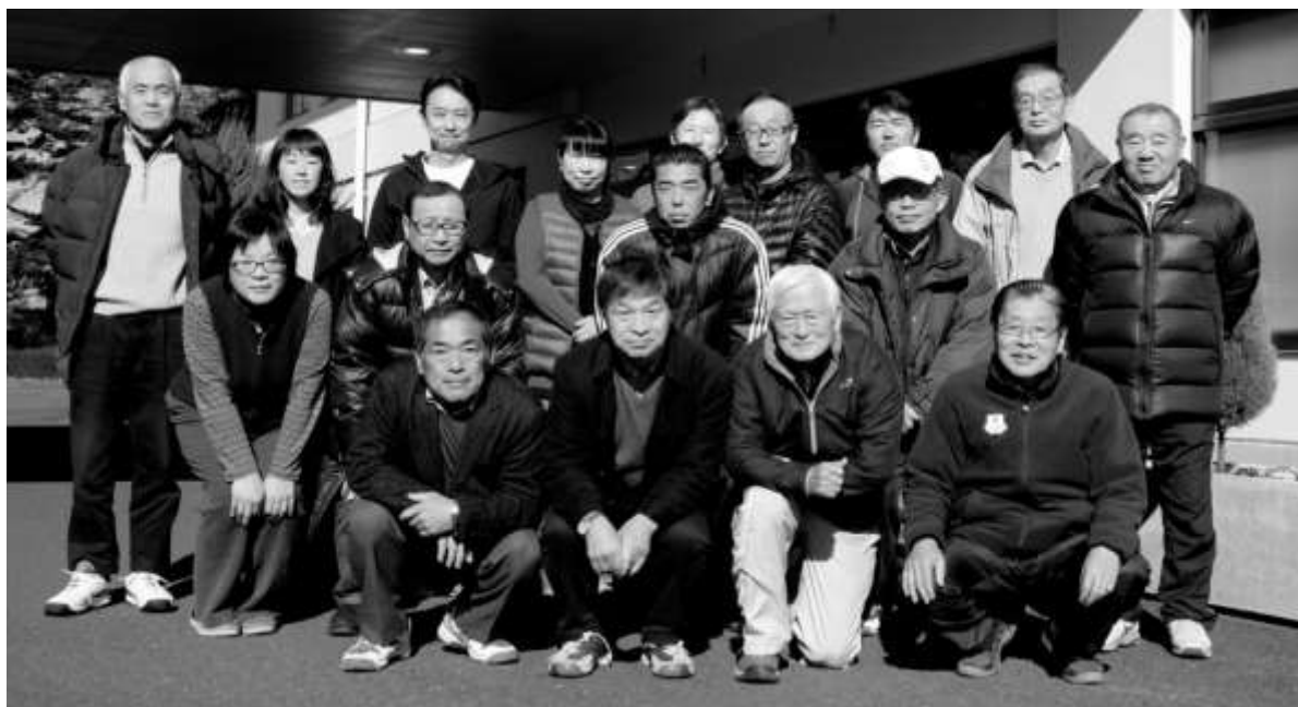
2018.1.13（土）昭和の森ゴルフクラブにて 理事会終了後 撮影