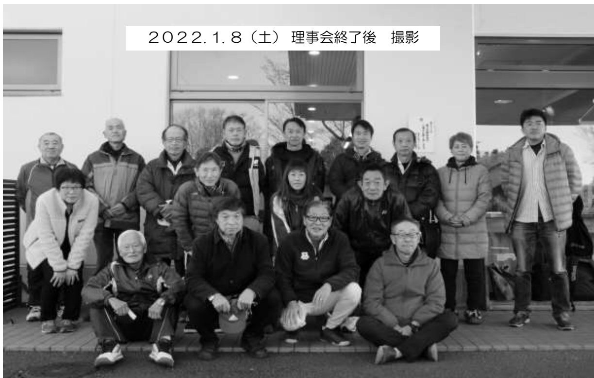
2022.1.8 (土) 理事会終了後 撮影